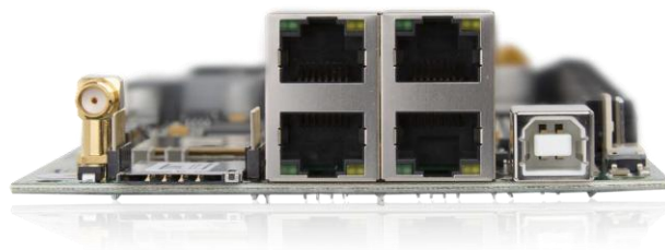
Abb.: SIRO-Port N Baugruppe TLL 6