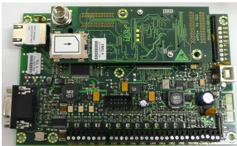
Abb.: TAS-Link NG - IP/GSM(GPRS)