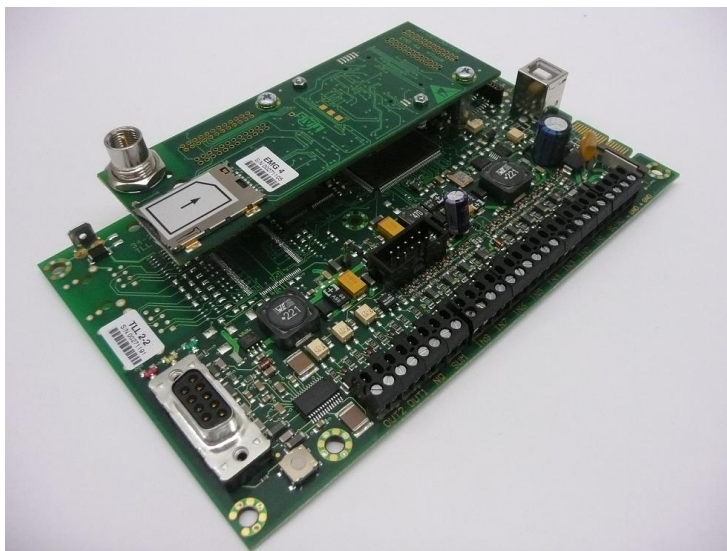
Abb.: TAS-Link NG - GSM(GPRS)