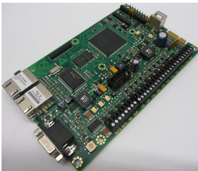
Abb.: TAS-Link NG - DuoIP