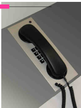
Abb. links: FEP-IP 4 Einbautelefon