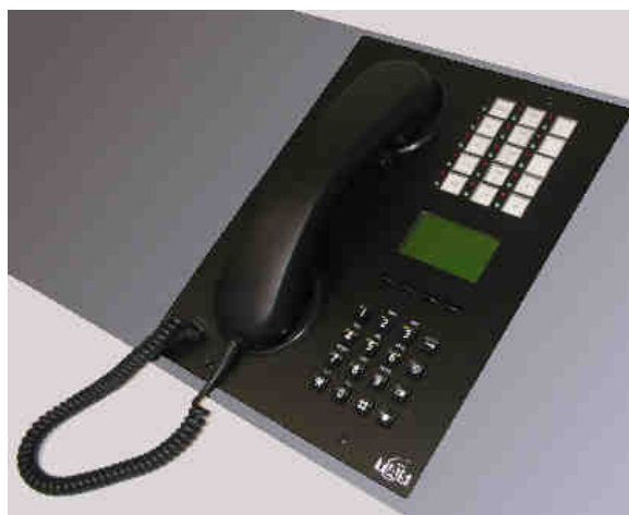
Abb.: FEP-IP 4 mit Display, Zielwahltasten und Magnethalterung für den Handapparat